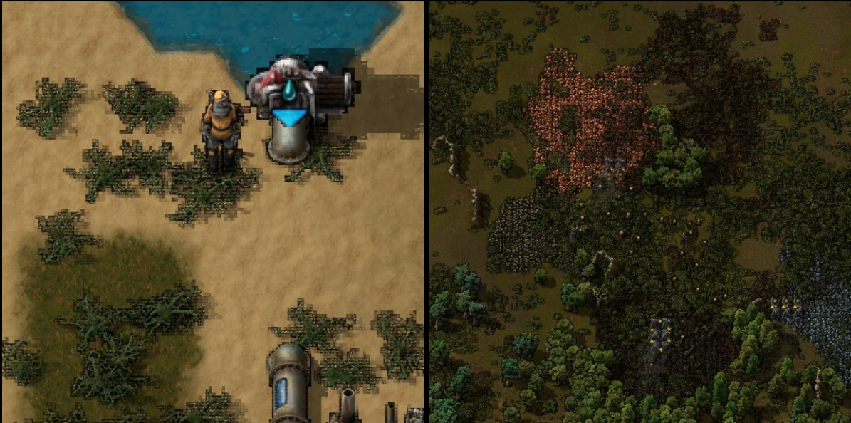
C'est presque un effet "shader-cell"

Vu que l'on a refait tout le moteur graphique du jeu, il est donc en cours de test et cela donne des résultats intéressants et même très sympas.