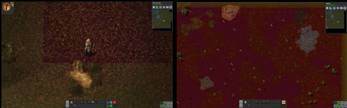
Les tuiles sont lentement gorgées de sang.