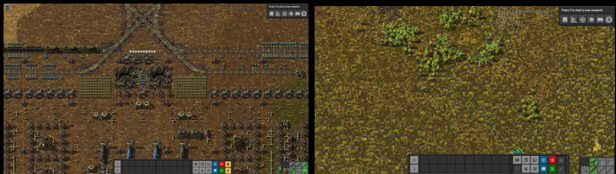
Celui-ci est juste bugué.